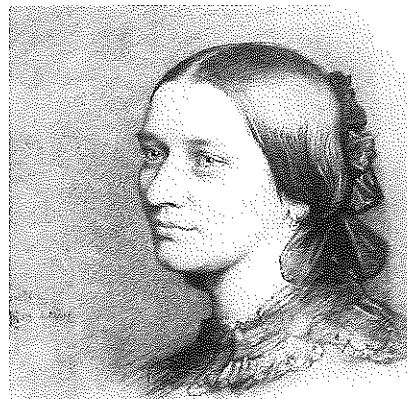
Clara Schumann im Spiegel der Liebeslieder von Robert Schumann & Johannes Brahms

Hausmusik mit Liedern und Kammermusik über die Liebe