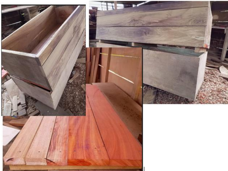
Abbildung 3: Bilder der mobilen Beete während der Bauphase

Die Durchführung des Projekts „Hühnerzucht und Gemüseanbau“ hat sich erheblich verzögert. Einer der Gründe dafür ist die Tatsache, dass wir die Reihenfolge der Umsetzung neu definiert hatten, sodass wir zunächst mit dem Gemüseanbau beginnen möchten und anschließend mit der Hühnerzucht. Die in Douala noch andauernde Regenzeit hat den Beginn des Gemüseanbaus weiter verzögert. Wir rechnen damit, dass mit dem Ende der Regenzeit Mitte November ein Beginn der Anpflanzungen zu vermelden sein wird. Abbildung 3 zeigt Bilder der mobilen Gemüsebeete während der Bauphase.