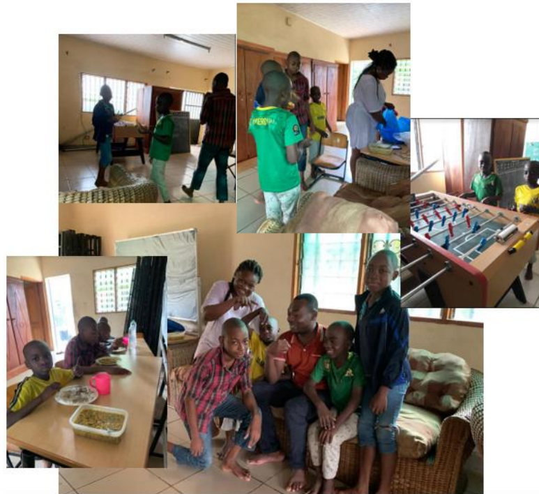
Abbildung 1: Aktuelle Bilder des Alltags in der Betreuungsstätte